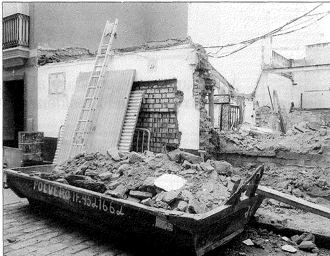
La que fue casa taller de Antonio Illanes, en la calle Antonio Susillo, ayer, durante su demolición.

EL MUNDO de Andalucía publicó en junio pasado las intenciones de la inmobiliaria para demoler la vivienda. Entonces, sólo faltaba que la Gerencia de Urbanismo concediera la licencia.